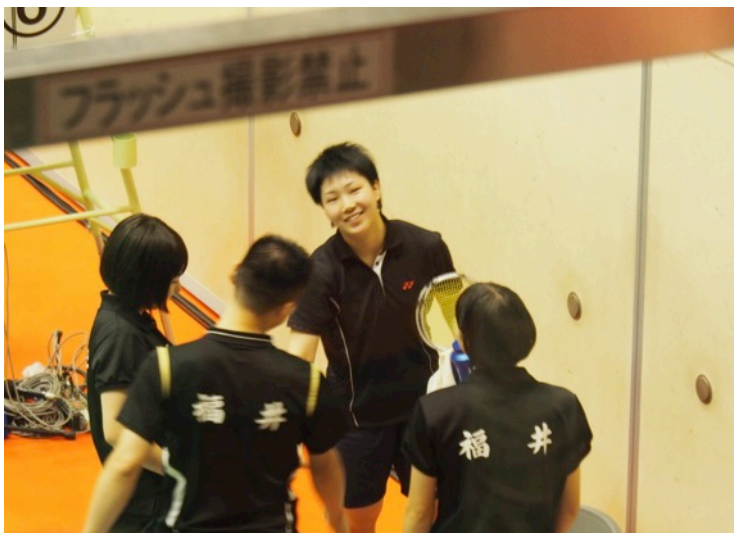
試合終了の山口さんを迎え、お互いの健闘を称えあう福井県チーム